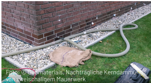
Nachträgliche Kerndämmung von zweischaligem Mauerwerk